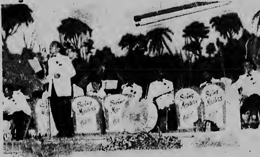
Hier ziet men een opname van de „SWINGMASTERS“ in volle actie.